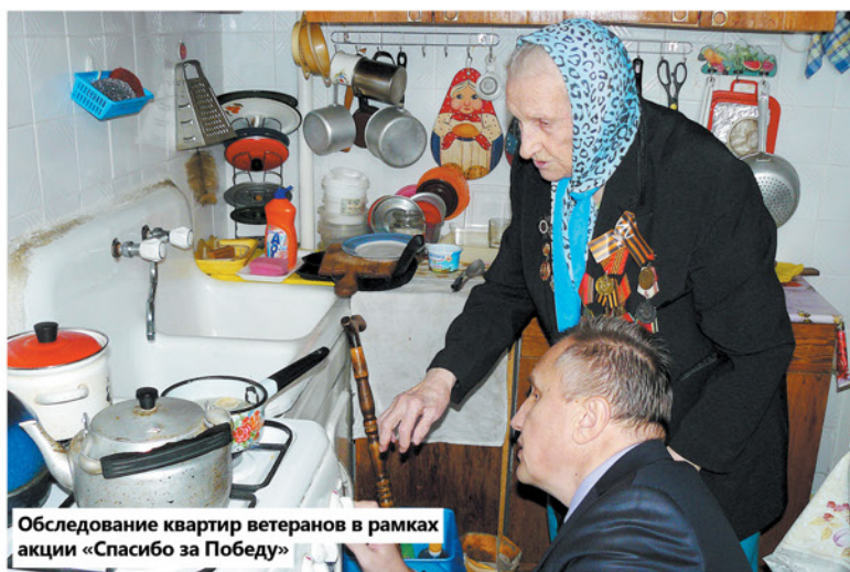
Обследование квартир ветеранов в рамках акции «Спасибо за Победу»

«ПРИНИМАТЬ РЕШЕНИЯ НАДО СОВМЕСТНО С ЖИТЕЛЯМИ»