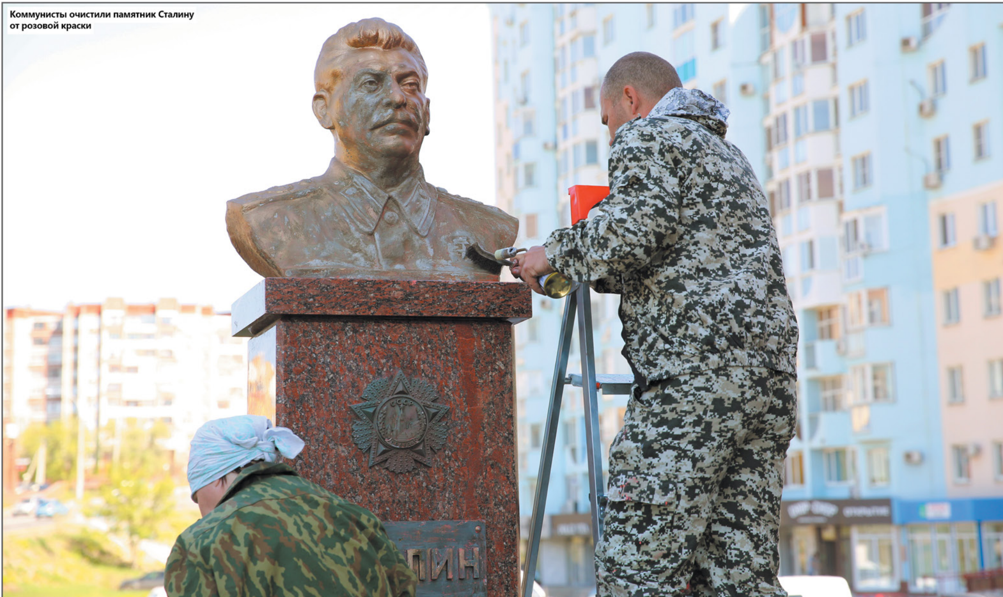
Коммунисты очистили памятник Сталину от розовой краски

ТЕКСТ: ВЛАДИСЛАВ ЮРЬЕВ. ФОТО: СЕРГЕЙ ПАРШИН