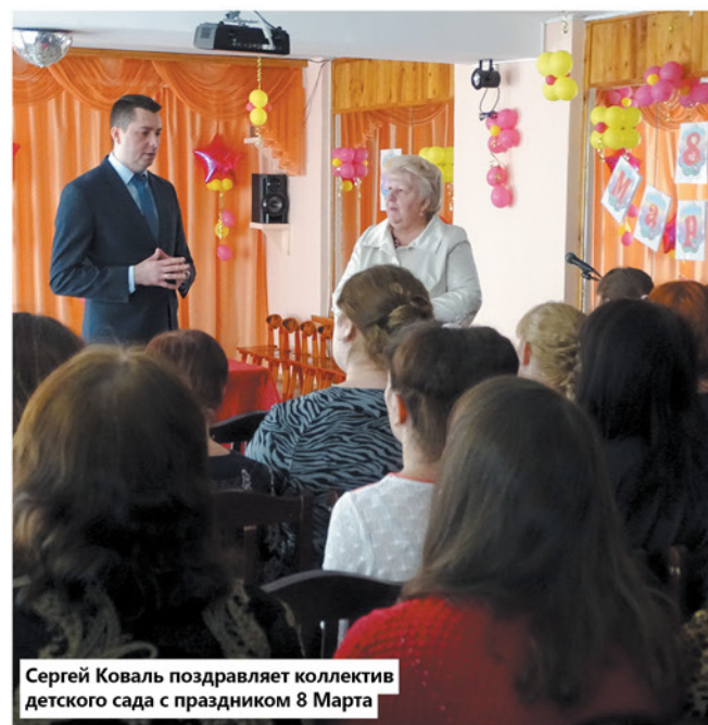
Сергей Коваль поздравляет коллектив детского сада с праздником 8 Марта

Если говорить о более глобальных вопросах, то мне хотелось бы отметить: сегодня нам необходима энергореформа, рыночные преобразования в энергетике. Наша отрасль сильно зарегулирована, и это отпугивает инвесторов. Они понимают, что если компания регулируется государством, то существуют определенные риски. Велика вероятность, что денежные средства вернутся не в том объеме или не в то время, на которое рассчитывает инвестор. Поэтому, конечно, необходима помощь государства, нужна энергетическая реформа, а вместе с ней увеличение числа альтернативных источников электроэнергии. Это направление пока распространено не так широко, в отличие от традиционной энергетики.