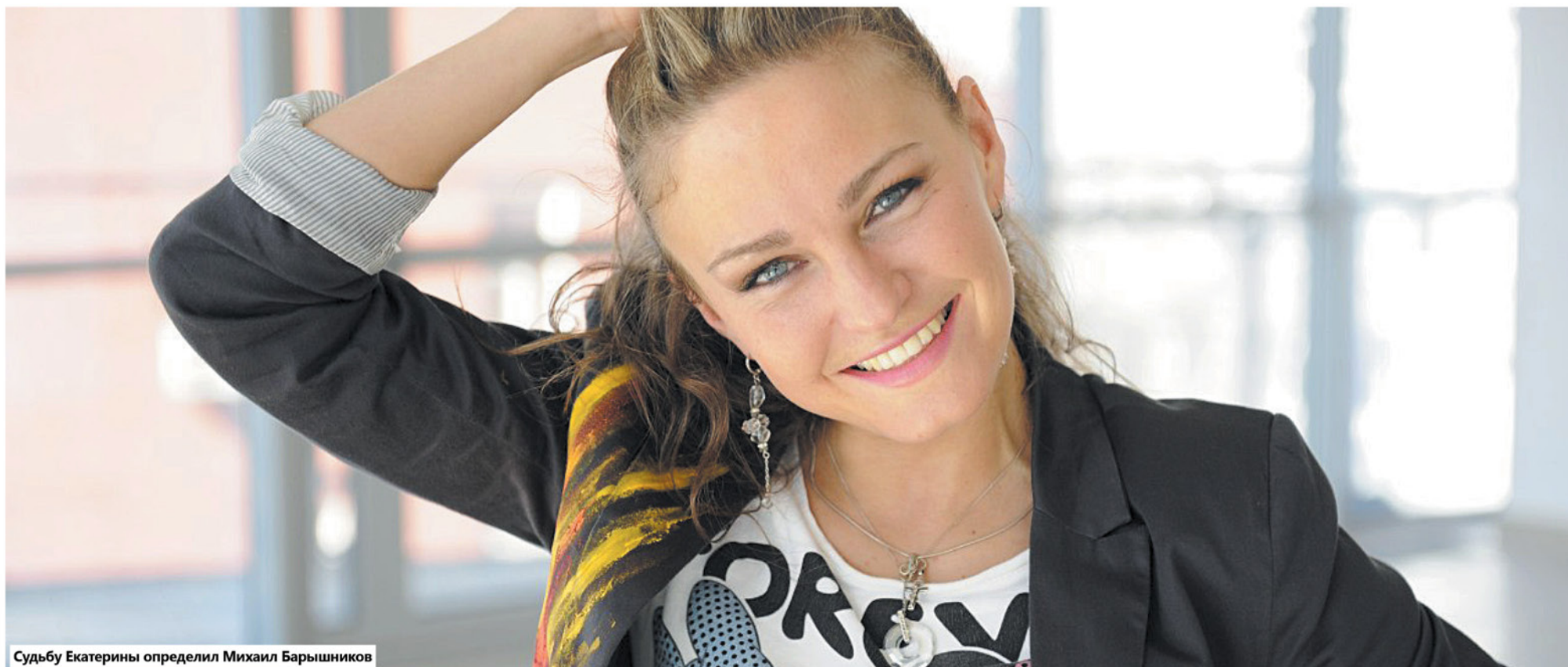
Судьбу Екатерины определил Михаил Барышников