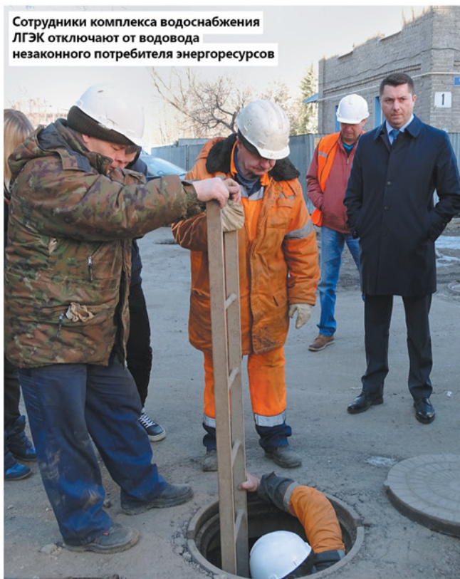
Сотрудники комплекса водоснабжения ЛГЭК отключают от водовода незаконного потребителя энергоресурсов

– Прежде всего, я вижу современное общество толерантным, более терпимым к окружающим. Нужно прини-