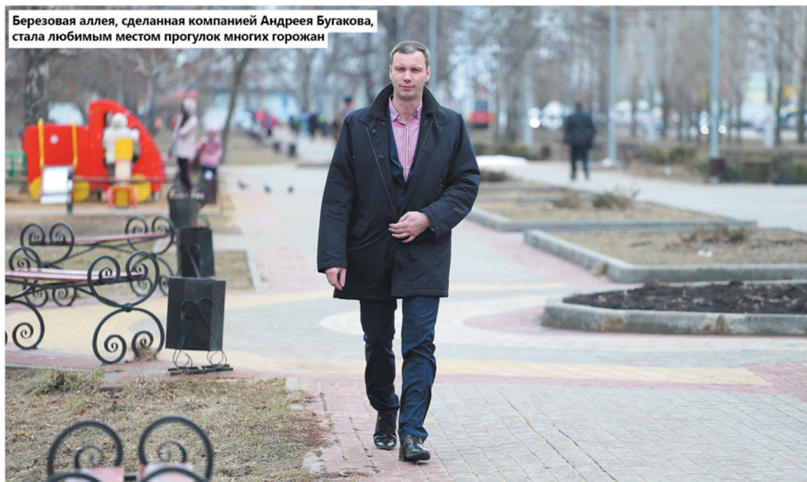
Березовая аллея, сделанная компанией Андрея Бугакова, стала любимым местом прогулок многих горожан

ТЕКСТ: ИРИНА МИХАЙЛОВА.