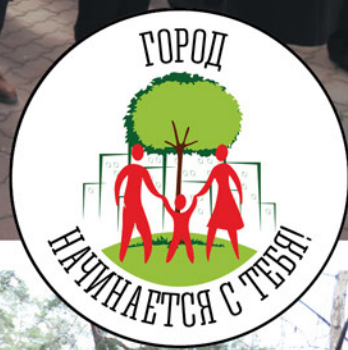
В ЛИПЕЦКЕ ДАН СТАРТ ДВУХМЕСЯЧНИКУ ПО УБОРКЕ ГОРОДА